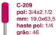
C-209 pol: 3/4x2.1/2 mm: 19,0x63,5 haste pol: 1/4 grão: 46