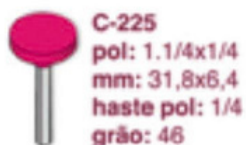
C-225 pol: 1.1/4x1/4 mm: 31,8x6,4 haste pol: 1/4 grão: 46