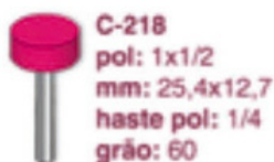
C-218 pol: 1x1/2 mm: 25,4x12,7 haste pol: 1/4 grão: 60