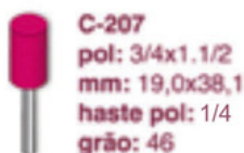
C-207 pol: 3/4x1.1/2 mm: 19,0x38,1 haste pol: 1/4 grão: 46