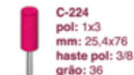
C-224 pol: 1x3 mm: 25,4x76 haste pol: 3/8 grão: 36