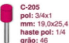
C-205 pol: 3/4x1 mm: 19,0x25,4 haste pol: 1/4 grão: 46