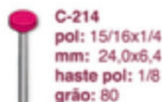
C-214 pol: 15/16x1/4 mm: 24,0x6,4 haste pol: 1/8 grão: 80