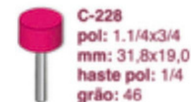
C-228 pol: 1.1/4x3/4 mm: 31,8x19,0 haste pol: 1/4 grão: 46