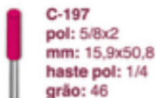
C-197 pol: 5/8x2 mm: 15,9x50,8 haste pol: 1/4 grão: 46