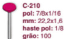
C-210 pol: 7/8x1/16 mm: 22,2x1,6 haste pol: 1/8 grão: 100