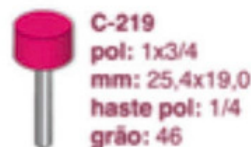
C-219 pol: 1x3/4 mm: 25,4x19,0 haste pol: 1/4 grão: 46