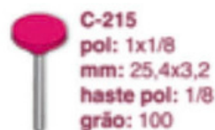
C-215 pol: 1x1/8 mm: 25,4x3,2 haste pol: 1/8 grão: 100