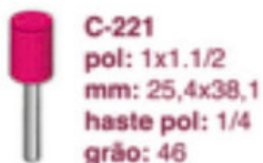
C-221 pol: 1x1.1/2 mm: 25,4x38,1 haste pol: 1/4 grão: 46