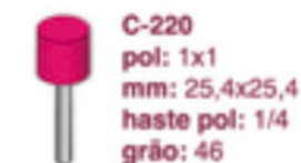
C-220 pol: 1x1 mm: 25,4x25,4 haste pol: 1/4 grão: 46