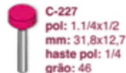
C-227 pol: 1.1/4x1/2 mm: 31,8x12,7 haste pol: 1/4 grão: 46