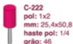
C-222 pol: 1x2 mm: 25,4x50,8 haste pol: 1/4 grão: 46