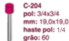
C-204 pol: 3/4x3/4 mm: 19,0x19,0 haste pol: 1/4 grão: 60