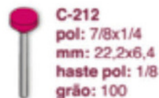
C-212 pol: 7/8x1/4 mm: 22,2x6,4 haste pol: 1/8 grão: 100