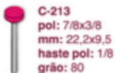
C-213 pol: 7/8x3/8 mm: 22,2x9,5 haste pol: 1/8 grão: 80