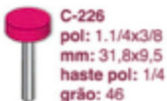
C-226 pol: 1.1/4x3/8 mm: 31,8x9,5 haste pol: 1/4 grão: 46