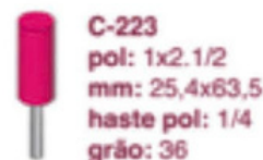
C-223 pol: 1x2.1/2 mm: 25,4x63,5 haste pol: 1/4 grão: 36