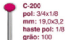
C-200 pol: 3/4x1/8 mm: 19,0x3,2 haste pol: 1/8 grão: 100