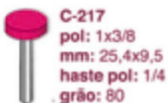
C-217 pol: 1x3/8 mm: 25,4x9,5 haste pol: 1/4 grão: 80