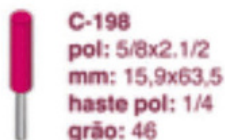
C-198 pol: 5/8x2.1/2 mm: 15,9x63,5 haste pol: 1/4 grão: 46