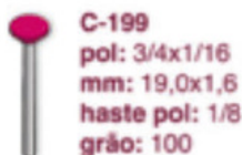
C-199 pol: 3/4x1/16 mm: 19,0x1,6 haste pol: 1/8 grão: 100