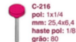
C-216 pol: 1x1/4 mm: 25,4x6,4 haste pol: 1/8 grão: 80