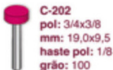
C-202 pol: 3/4x3/8 mm: 19,0x9,5 haste pol: 1/8 grão: 100