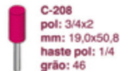
C-208 pol: 3/4x2 mm: 19,0x50,8 haste pol: 1/4 grão: 46