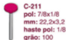
C-211 pol: 7/8x1/8 mm: 22,2x3,2 haste pol: 1/8 grão: 100