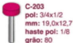
C-203 pol: 3/4x1/2 mm: 19,0x12,7 haste pol: 1/8 grão: 80